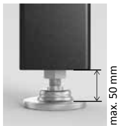
Fußverstellung Feinjustierung max. 50 mm

Option Lenkrollen: Stellen Sie die feststellbare Lenkrolle bereits vor der Montage fest.