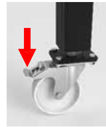
Option: Lenkrolle Feinjustierung max. 30 mm