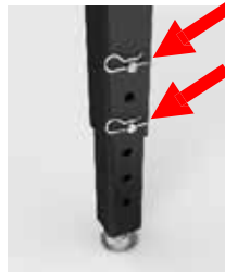
Option: Höhenverstellung Feinjustierung max. 40 mm