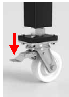
Option: Lenkrolle Feinjustierung max. 20 mm