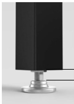
Fußverstellung Feinjustierung max. 50 mm

Option Lenkrollen: Stellen Sie die feststellbare Lenkrolle bereits vor der Montage fest.