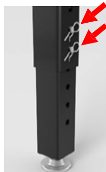
Option: Höhenverstellung Feinjustierung max. 50 mm